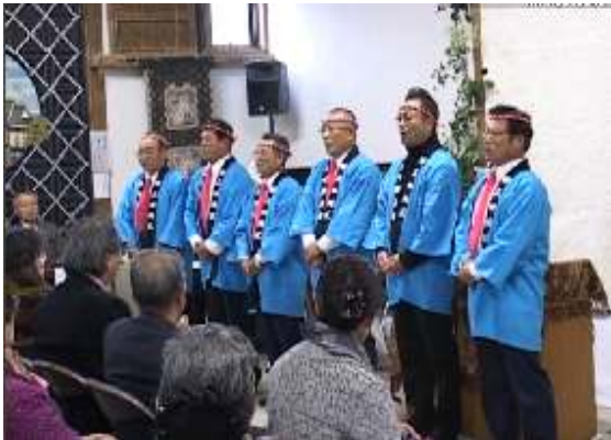
いわい唄の皆さん